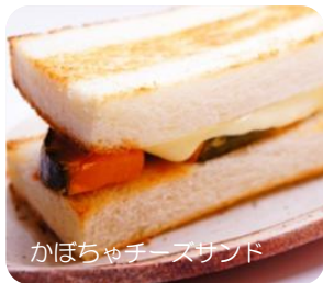
かぼちゃチーズサンド