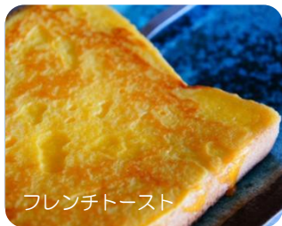
フレンチトースト