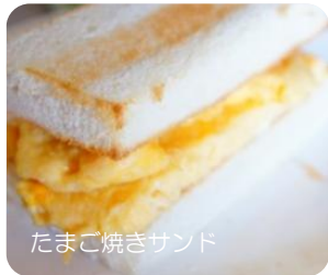
たまご焼きサンド