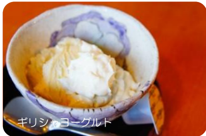
ギリシャヨーグルト