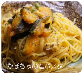
かぼちゃの塩パスタ