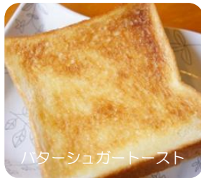
バターシュガートースト