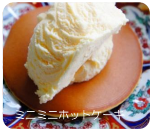
ミニミニホットケーキ