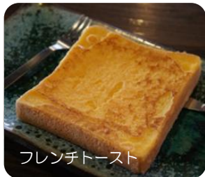
フレンチトースト