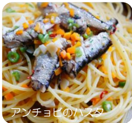
アンチョビのパスタ