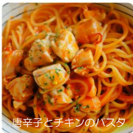
唐辛子とチキンのパスタ