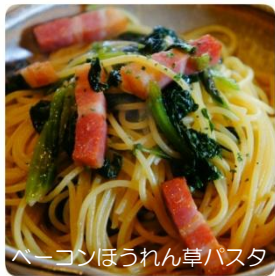
ベーコンほうれん草パスタ